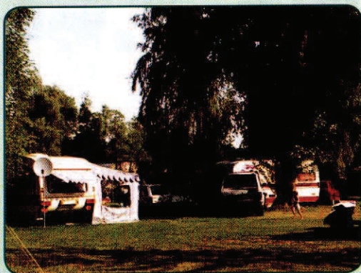
Campingplatz Forelle Steyr

Auf einer ebenen, teilweise mit altem Baumbestand bewachsenen Rasenfläche von 6000 m 2 befinden sich 50 Abstellplätze, 5 Terminals mit 60 Stromanschlüssen, Platzbeleuchtung, ausreichende Sanitäranlagen (inkl. Versehrten Dusche WC) und eine Waschmaschine.