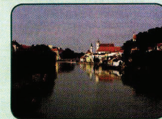
Campingplatz Forelle Steyr